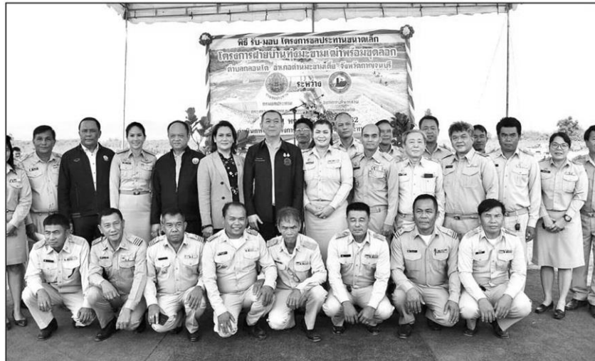
ลงพื้นที่ : นายเฉลิมชัย ศรีอ่อน รัฐมนตรีว่าการกระทรวงเกษตรและสหกรณ์ ติดตามการดำเนินงานแก้ปัญหาภัยแล้ง บริเวณลานวัฒนธรรมวัดอินทาราม (วัดหนองขาว) ต.หนองขาว อ.ท่าม่วง และบริเวณฝายบ้านทุ่งมะขามเตี้ย อ.กอลอนโด อ.ด่านมะขามเตี้ย จ.กาญจนบุรี เมื่อเร็วๆ นี้