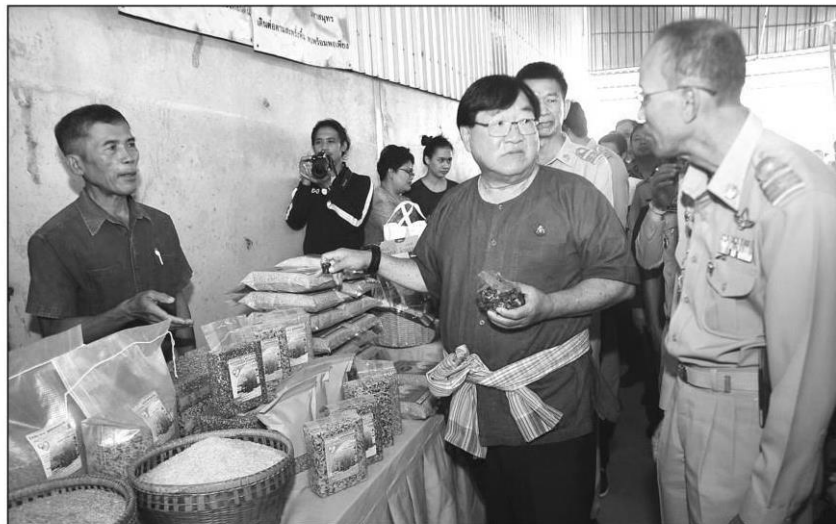
ข้าวอินทรีย์ : นายประภัตร โพธสุธน รัฐมนตรีช่วยว่าการกระทรวงเกษตรและสหกรณ์ ลงพื้นที่จ.สุพรรณบุรี ตรวจเยี่ยมกลุ่มข้าวอินทรีย์ศรีสุพรรณ บ้านวังพลับใต้ ต.มดแดง อ.ศรีประจันต์ จ.สุพรรณบุรี ซึ่งผลิตข้าวอินทรีย์ที่ไม่ใช้สารเคมีทางการเกษตรทุกชนิด